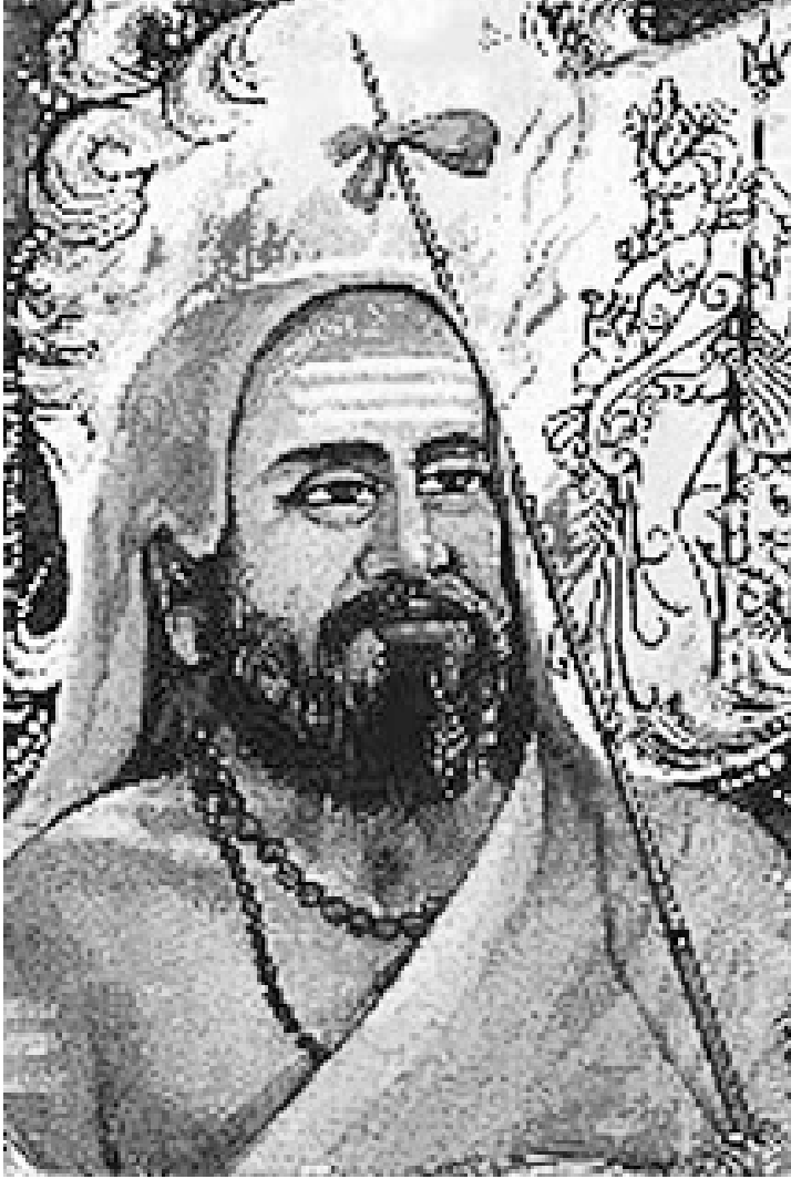
Jagadguru Shankaracharya Vidyaranya Swami

श्री विद्यारण्य व ज्ञानेश्वर यांच्या वेदांतावरील मतांचें तात्पर्य